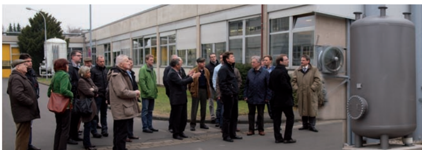
VDI/VDE Mitglieder bei der Betriebsbegehung am Kältespeicher mit Kraft-Wärme-Kälte-Kopplung (Aufstockung Technikzentrale mit neuem Absorptions-Kälteaggregat nicht im Bild).

Der Gang über das Betriebsgelände mit der neuen Heizzentrale, BHKW/KWK, rundet die Erkenntnisse der Vorträge ab.