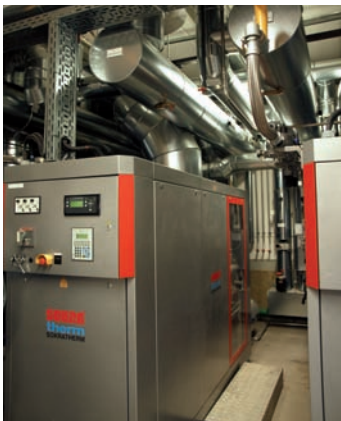
Einblick in die Heizzentrale mit 2 BHKW-Modulen je 140 kW el

Eckhard Fangmeier auf Energietour durch die Mahr-Betriebe