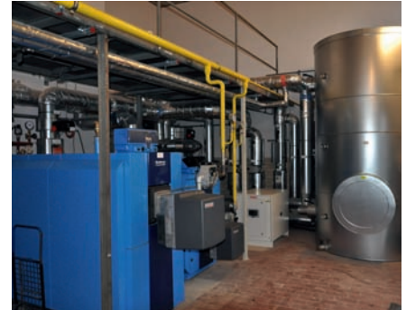
Heizwärme-Verteilung mit Hocheffizienz-Pumpen (Bild links) Neue Heizzentrale mit Effizienzmodul und Pufferspeicher (Bild rechts)

Mit ingenieurtechnischer Systemabstimmung des gesamtheitlich zu betrachtenden Schulkomplexes wurde der energetische und wirtschaftliche Erfolg einer solchen Bestandsanierung – ohne einhergehende wärmedämmtechnische Gebäudeverbesserungen – realisiert.