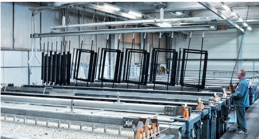
Eloxalanlage – Prozesswärme und Eigenstrom aus BHKW