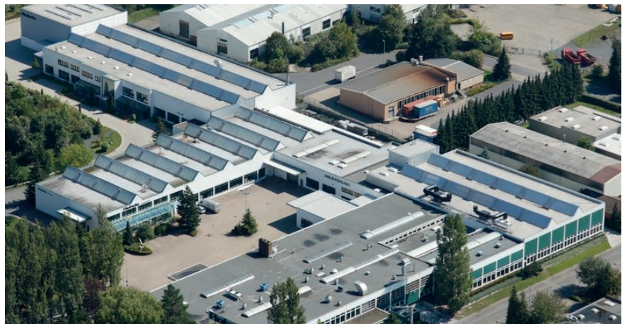
Rohde AG – Quality for Industry

Die zukunftsorientierte energetische Erneuerung bei der Rohde AG in Nörten Hardenberg ist ein übertragbares Vorbild für viele Mittelständische Unternehmen, um Energiekosten zu minimieren und ökologisch zu handeln.