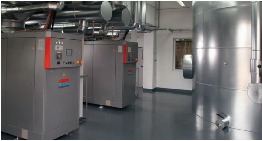
BHKW bei Rohde AG – Speicher 43 m 3